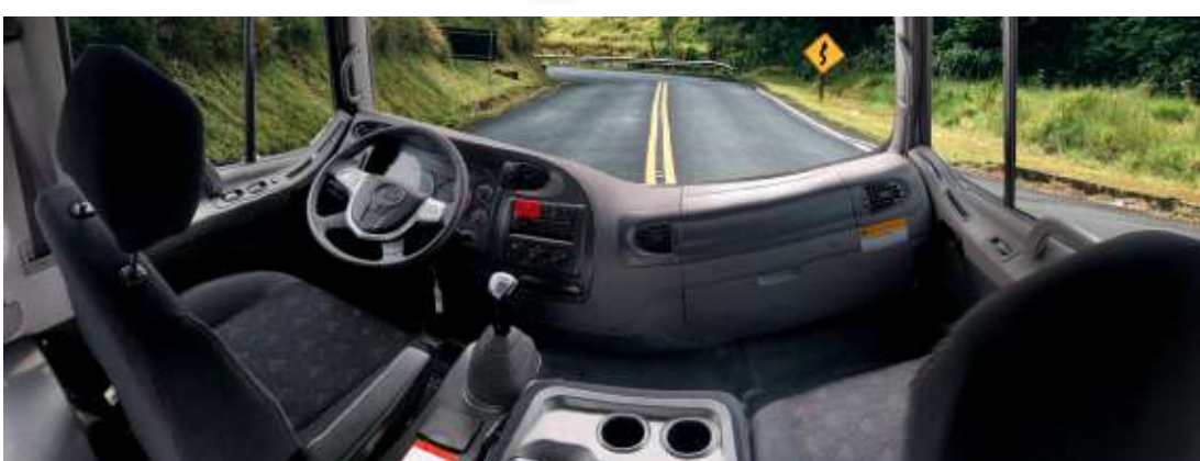
AMPLIA Y SEGURA CABINA CON VISTA PANORÁMICA